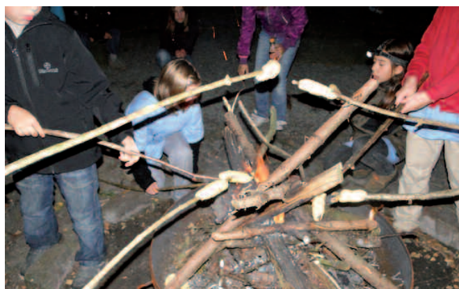
Die Natur mit Pflanzen- und Tierwelt erleben, Spaß und Freude bei Sport und Spiel haben und abends gemütlich am Lagerfeuer sitzen - das waren Inhalte einer Fahrt, bei der sich die neue Klasse kennenlernte, sich Freundschaften schlossen und alle viel Freude hatten.

der spielte, zeigte einem Kind, das alleine war, einen Smiley, dieses Kind war dann ermordet. Wenn der Mörder entlarvt wurde, begann ein neues Spiel. Das Spiel begann, ging über die ganze Kennenlernfahrt und ließ uns die Zeit nie lang werden.