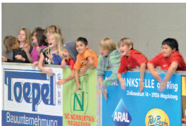
Nach der Turnieröffnung (beide Norbertus Mannschaften in Rot) ging es auch gleich zur Sache. Die Zuschauer feuerten die Mannschaften begeistert an, doch leider nützte auch das an diesem Tag nicht viel.

gegen Schönebeck sicher viel zur Moral beigetragen, aber unsere Jungen konnten die zweimalige Führung nicht verteidigen.