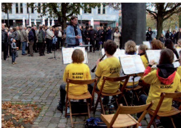
Unsere Bläserklasse am Bürgerdenkmal in der Lothar-Kreyssig-Straße

Auch Landtagspräsident Dieter Steinecke blickte in seiner Rede in den Sommer 1989 zurück, erinnerte an die Ereignisse in Prag und in Ungarn und hob den friedlichen Charakter der Umwälzungen und der Revolution von 1989/1990 hervor.