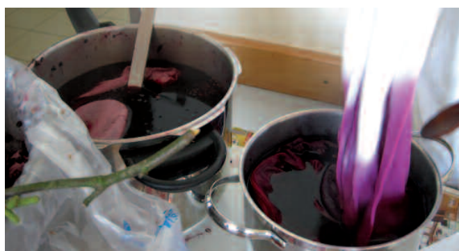
Was theoretisch besprochen wurde, setzte sich dann praktisch um - hier am Beispiel Färbepflanzen

von uns wusste schon vorher, das zum Beispiel Holunder oder Eberwurz gegen Bronchitis helfen können?